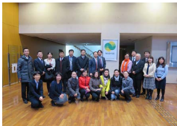
参加者による集合写真

機構からの説明の後、訪問者からは、機構の認証評価、国立大学法人評価の仕組みや公立大学の評価等について質問があり、日本の高等教育の評価制度全般について、高い関心を持っていることがうかがえ、熱心な質疑応答が行われました。